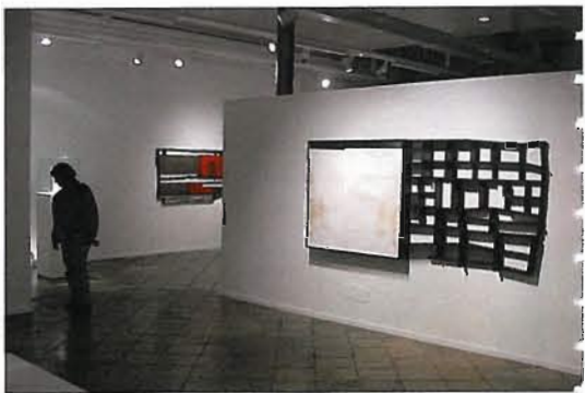
魯斯德雕塑展展場一景

邊用比較實質的材料描寫，另一邊則用比較空洞的空間來處理，讓其雕塑畫面（他的作品風格特色之一就是掛在牆上的雕塑）看起來有實有虛之對稱平衡，對稱的完美，沒有理由苦惱——似書架的書架空空的，不用讀書，更沒有理由苦惱。