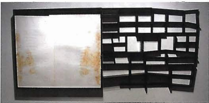
下·魯斯德 沒有理由的苦惱

巴塞隆納最近出現一座非常熱門且前衛性的藝廊——維拉加莎基金會當代前衛展場（La Fundacion Vila Casa），是一座以當代年輕藝術家為訴求的畫廊。這座藝廊首度展出的藝術家，即是千挑萬選出來的——當紅西班牙